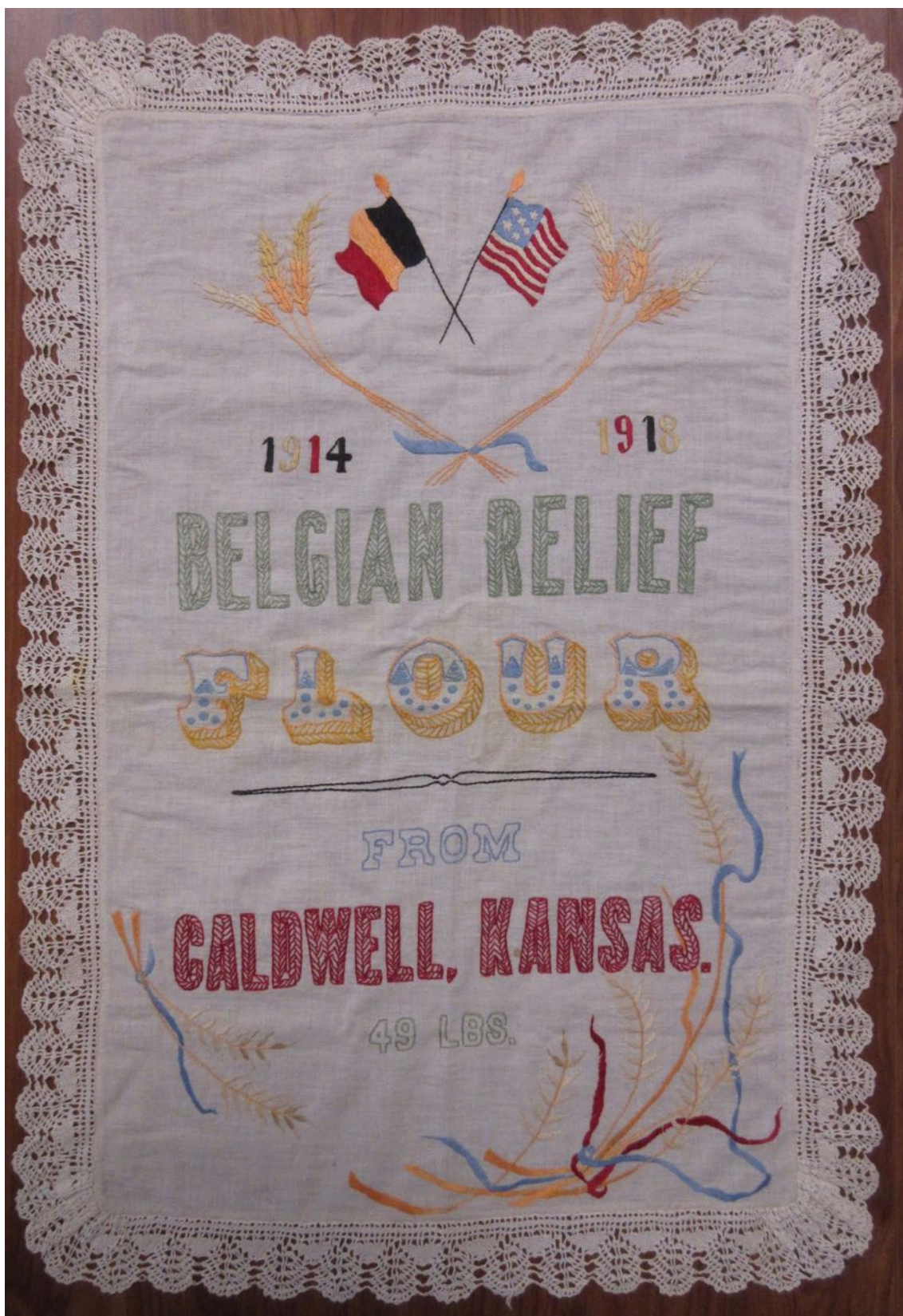
Un Célèbre Sac à Farine Flamand au Pays de Nevele