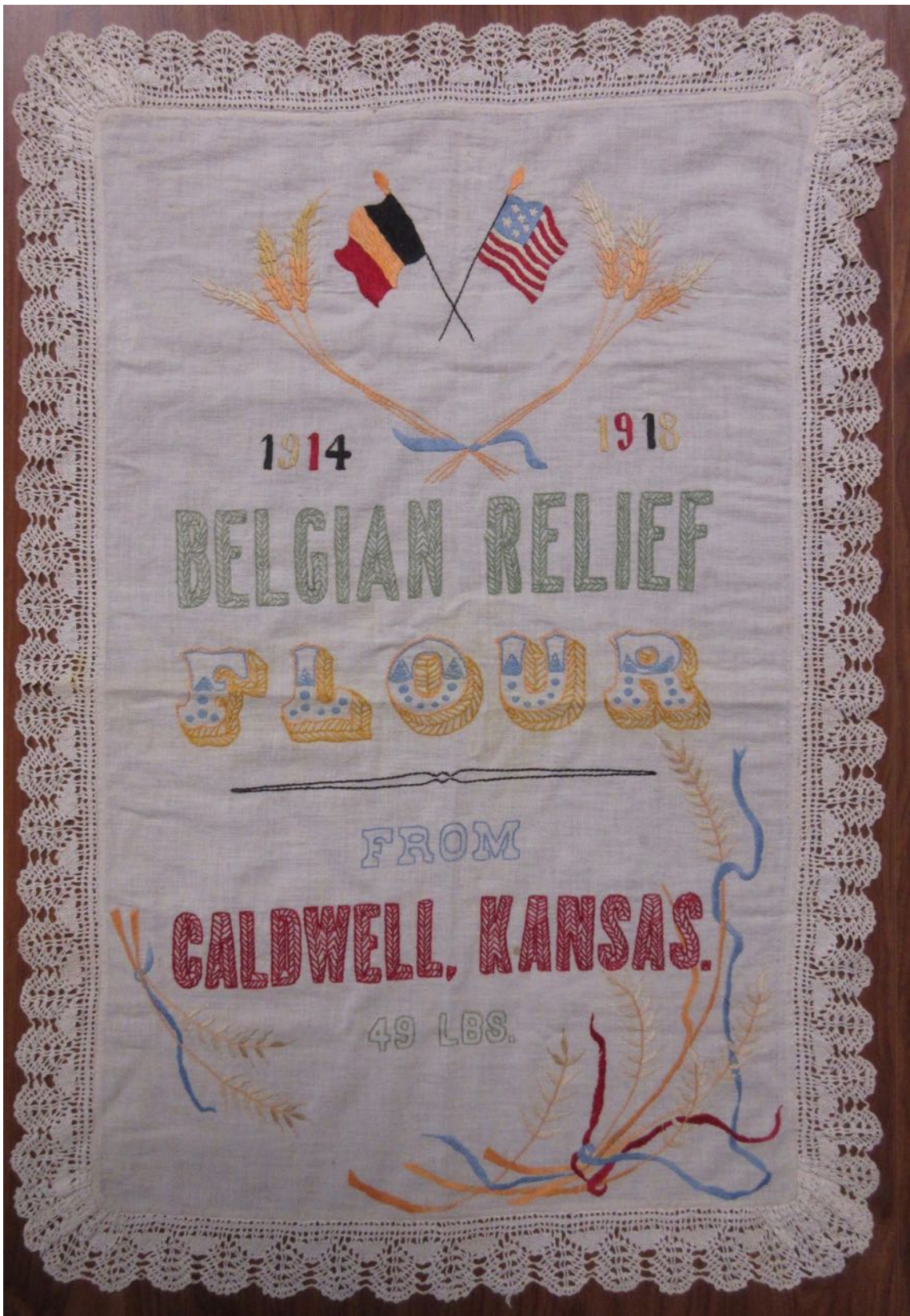
Een Bekende Vlaamse Meelzak in Het Land van Nevele